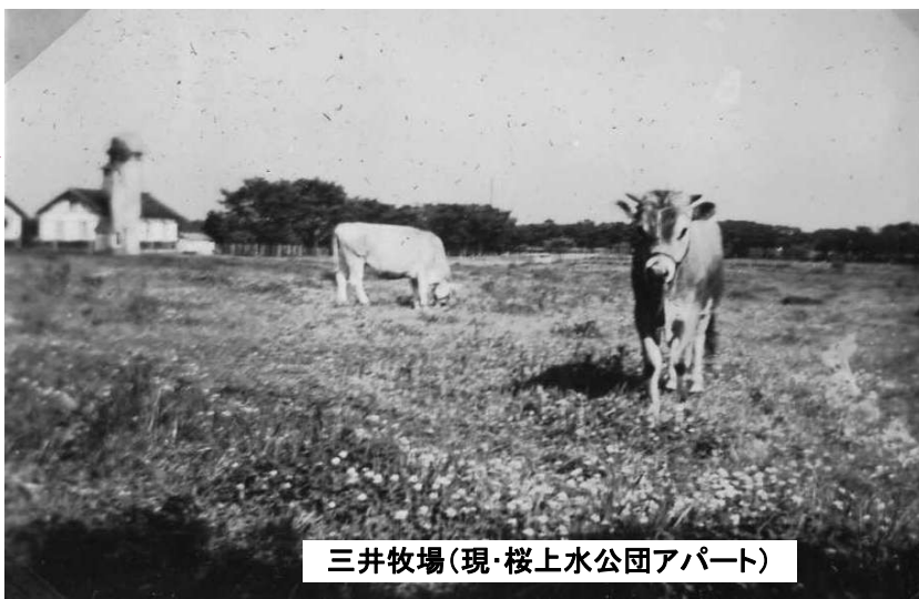
三井牧場(現・桜上水公園アパート)