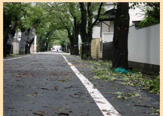
7日の朝 台風一過の桜並木